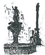
Rynek Fontanna z Neptunem